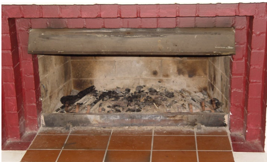
Ein Kaminzimmer hat bei der Resolutionsentsorgung so seine Vorteile

Nun bleibt zu hoffen, dass auch das von manchen als leidig betrachtete Thema der Reform des Sicherheitsrates heute nicht die Stimmung im Ausschuss wird verschlechtern können. Aber so wie ich den Sicherheitsrat in den letzten Tagen kennengelernt habe wird wohl selbst das Gepoker um die Vetos trotz der ständig präsenten Vetofalle noch Spaß machen!