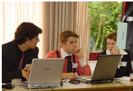
Während die Schweiz noch grübelt, wird im Sudan schon gefeiert

Bei den Nachhaltungs-Kollegen von der WP gab's noch eine Resolution zum Thema Technologietransfer zu besprechen, eingebracht von Großbritannien und Frankreich. Diese beinhaltete eine kollektive Rüge der Entwicklungsländer für ihr Fehlverhalten in Sachen Entwicklungshilfe. Leider enthielt der Entwurf ansonsten nicht viele neue Lösungen des Problems. Der Transfer von Schlüsseltechnologien wurde weiter als notwendig befunden, aber anscheinend gibt es noch Problem mit der Effizienz. Die gesammelten Anschuldigungen Richtung Süden wurden von einer ganzen Meute Entwicklungsländer in den Absätzen entschärft. Interessanterweise blieb das Ergebnis der Debatte noch offen: die letzten operativen Absätze konnten aus Zeitgründen nicht mehr behandelt werden und werden bei Gelegenheit im WiSo ausgekugelt. Fazit: Die WP hat sich zwar der Resolution enthalten, kann aber auch unter Druck hoch produktiv arbeiten.