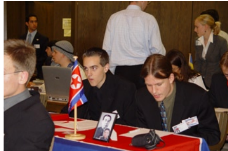
Nordkorea mit Tischdecke

Die letzten Minuten wurden zur Qual. Zwar einigte man sich darauf, die gesamte Resolution vorzeitig zur Abstimmung zu stellen, aber nur unter der Voraussetzung, einen Teil extra abzustimmen. Da kam jemand auf die glorreiche Idee zu Teilen. Also wurde geteilt, und geteilt, und geteilt, und geteilt - bis man fünf...na?...Teile