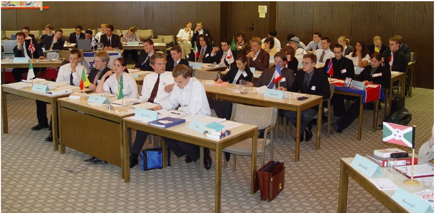
Die mächtige GV im Konferenzsaal des AZK

Auf der achten SPUN Sitzungswoche wurde feierlich die Generalversammlung eröffnet, die sich aus den Delegationen, die vorher in der Abrüstungskommission, der Internationalen Rechtskommission und der Sonderkommission für ökologische Nachhaltigkeit vertreten waren, zusammensetzt. Das Gremium verzichtete auf eine lange Eröffnungszeremonie