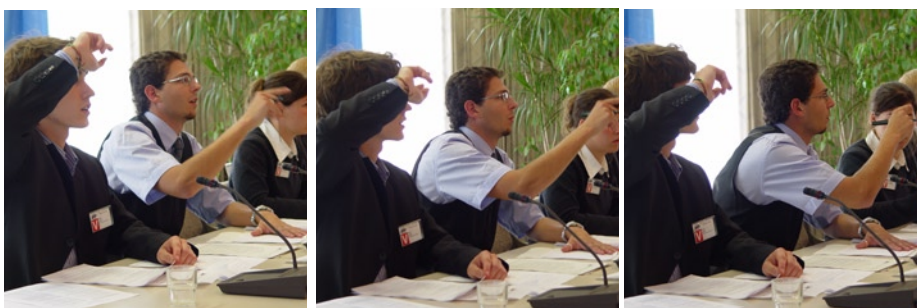
La Ola in der GV: Zählmaschinen bei der Arbeit