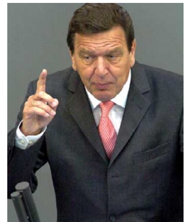
Und teuer war sie außerdem!

Schröder selbst konnte seinen Stolz darüber, nur einen Tag nach der Vereidigung des neuen Bundespräsidenten Horst Köhler schon wieder die Schlagzeilen der Republik zu beherrschen, kaum verhehlen: „Na, wie hab ich das wieder gemacht? Dolle Sache, oder?“