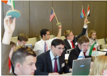
Die GV verhackstückt...

Dann ging man zum dritten Tagesordnungspunkt über: Der Resolutionsentwurf der Abrüstungskommission mit dem Titel „Atomkriegsgefahr“. Vielleicht lag es an dem heftigen Übergang von der friedlich zukunftsorientierten ÖN-Resolution zum hochexplosiven Thema der Abrüstungskommission, dass es plötzlich enormen Klärungsbedarf bezüglich verschiedenster Punkte gab: Um sich selbst