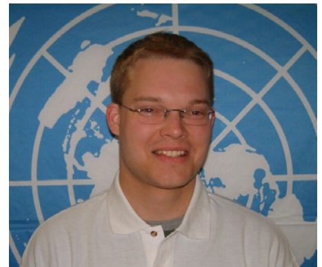
Junge, komm bald wieder!

Das schöne an SPUN ist, dass es jedem die Möglichkeit bietet, genau das zu tun, was er kann, es kommt nur auf die Eigeninitiative an: Wenn ihr beim nächsten Seminar auftaucht und sagt ihr habt da eine Idee für die nächste Sitzungswoche, wird niemand sagen "Das haben wir aber noch nie so gemacht", sondern im Gegenteil eher antworten: "Super, nimm das in die Hand und dann machen wir das so". Alle Teile von SPUN, sei es nun die Homepage, die SPUNited oder die Nations Night sind über die Zeit entstanden, weil irgendein Teilnehmer oder Orga-Mensch mal gesagt hat, "das wäre doch eine tolle Idee" und diese dann auch umgesetzt hat. Ich würde mich freuen, wenn sich diese Tradition fortsetzt und das Projekt über die Zeit weiter wächst, mit Euren Ideen und durch Euren Input. Denn neben "von Schülern für Schüler" war "SPUN ist, was ihr daraus macht" immer das zweite tragende Motto