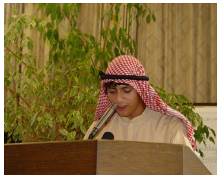
Saudi-Arabien bespricht die GV

Die USA sprachen von ihrer verwundeten Seele nach dem 11. September und davon, dass sie Freiheit und Demokratie in die Welt