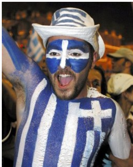
Hellas auf dem Weg in die Ottokratie

Der bislang nur in Skandinavien populäre Volkssport Frauentragen hat positive Resonanz beim Olympischen Komitee erhalten. Demnach wird es ab den Sommerspielen 2008 in Peking einen Olympiasieger im Frauentragen geben. Um den Bekanntheitsgrad dieser Sportart zu erhöhen wurden jetzt erstmalig im deutschen Fernsehen Bilder der norwegischen Landesmeisterschaft übertragen. Die Teilnehmer müssen die exakt 60 kg schweren Frauen über eine 500 Meter lange Strecke, die die erste Hälfte durch ein 80 cm tiefes Wasserbecken führt, möglichst schnell ins Ziel tragen. Moderiert wurde der Event vom ARD-Starduo Gerhard Delling und Günther Netzer: „Für den Fall, dass die deutsche Fußballnationalmannschaft in Kürze aufgelöst wird, suchen wir schon mal nach Alternativen“, sagte der Ex-Kicker. Frauenrechtler Marius Rosenberg zeigte sich ebenfalls angetan: „Es mag zwar auf den ersten Blick diskriminierend aussehen, aber wenn man es zwei- oder dreimal gemacht hat, ist es sehr schön.“