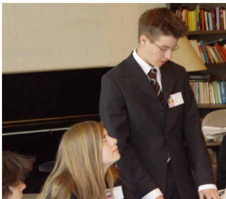
Seit letzter Nacht himmelt Russland Rumänien an.

Der Vorsitz vermisste besonders am Anfang der Debatte die nötige Disziplin innerhalb des Ausschusses und die stellvertretende Vorsitzende sah sich deshalb dazu berechtigt selbst freundliche Änderungsanträge einzubringen, was vom Vorsitz mit den Worten „hier sind 15 Leute aus der Oberstufe, kommt gar nicht in Frage, denen wird ja wohl selber was einfallen“ unterbunden wurde „und wehe einer petzt bei der SPUNited“. Aus Anlass des Geburtstags der russischen Delegierten hatte er dennoch ein Nachsehen, gewährte ein Ständchen zu Beginn der Debatte: „Happy Birthday liebes Russland...“ und ließ sogar den Verzehr des mitgebrachten Schokoladenkuchens zu.