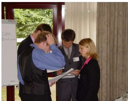
Technologen bei der Arbeit

Zunächst ging es um den „Technologietransfer“. Das Thema wurde ausführlich debattiert, da es zum einen in der Sonderkommission für Nachhaltigkeit in Wirtschaft und Politik nur verhältnismäßig kurz zur Sprache kam, und zum anderen einige kritische Töne gegenüber den „Entwicklungs- und Schwellenländern“ enthielt. Im Laufe der Debatte wurde sie in dieser Beziehung jedoch entschärft, so dass die betroffenen am Ende für die Resolution stimmten.