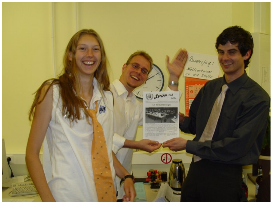
Königswinter, 2:00 Uhr: Die Zeitung hält. Alaauf!