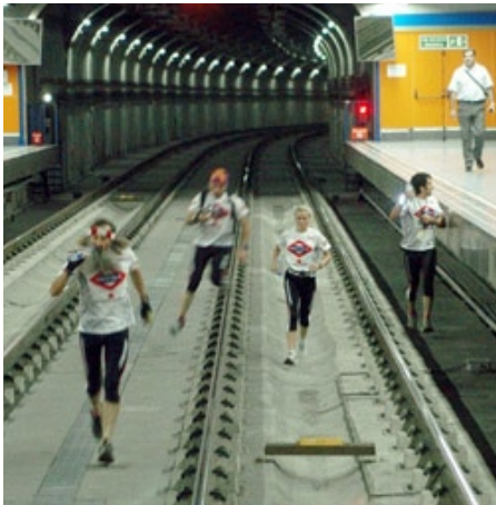
Die Hatz nach der U-Bahn ins Glück

Vier SPUN-Delegierte verpassten am Freitagabend den letzten Zug, der sie von Bonn zurück Richtung Königswinter bringen sollte. Der Versuch, der gerade abgefahrenen U-Bahn hinterher zu rennen und aufzuspringen schlug fehl. Nach einem kurzen Sprint befanden sich die vier SPUNer mitten im Bonner Untergrundsystem. Da der nächste entsprechende Zug erst vier Stunden später fuhr, entschlossen sie sich spontan im Tunnel zu verweilen. Um die aufkommende Langeweile zu überbrücken, ritzte ein Delegierter mit seinem Taschenmesser eine Resolution in die Wand des unterirdischen Bauwerks. Der Titel: „Aktionsprogramm für Bürgersteige in U-Bahn-Tunneln“. Sie wurde um kurz vor fünf Uhr mit Doppelveto abgelehnt. Ob die U-Bahn-Raser bereits wieder im Tagungszentrum Königswinter eingetroffen sind, ist bis jetzt nicht bekannt. Ein Abguss der Resolution befindet sich bereits auf dem Weg ins Haus der Geschichte in Bonn.