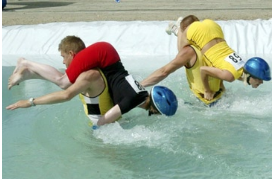
Auch Alice Schwarzer hat schon angefragt...

Erwischt! Der Delegierte Griechenlands hat sich heimlich aus dem Staub gemacht um beim EM-Finale in Portugal seinem Team zujubeln zu können. Nachdem er sich den gesamten Vormittag über von seinem Mitdelegierten den Bauch bepinseln ließ, fuhr er am Nachmittag noch kurz bei Petros´ Gyrosbude vorbei um sich schon mal