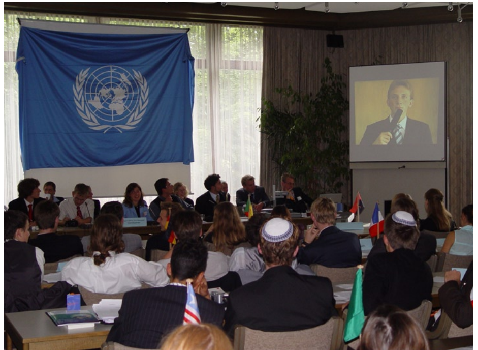
Güterslob calling... Die große Liveschaltung in der GV

Dass sie nicht nur die Chance hätte, sondern sicher Europameister würden, war die klare Ansage der griechischen Delegation. Die Britannen bliesen den Wind der Freiheit und den Sturm des Krieges durch den Raum, und als Human Rights Watch für seine Rede frenetischen Beifall bekam, verbot die Vorsitzende jedwede „Akklamationssessions“ bis auf Weiteres. Mit dem Roten Kreuz trat dann nach eigenen Bekunden die