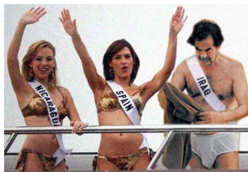
Saddam besticht durch seine inneren Werte

an die UN. Nach einem Beratungsgespräch bei Ex-Generalsekretär Heiko Hilken stand der irakische Kandidat für die Wahlen der Miss World fest: Vertrauend auf Hilkens Wahlspruch „Macht macht sexy!“ wurde der beliebteste Auslandspolitiker endsendet. Im Bikini-Contest ist er den weiblichen Mitbewerberinnen immer eine Länge voraus und auch bei der Frage- und Talentrunde konnte er die Jury überzeugen. Auf die Frage nach seinem größten Traum antwortete er als erste Teilnehmerin seit 1923 nicht mit dem Satz „World Peace“ sondern mit „World Domination.“ Prompt hatte er die Wahl gewonnen und hat jetzt einen einjährigen Modellvertrag bei Victoria's Secret in der Tasche (oberes Bild).