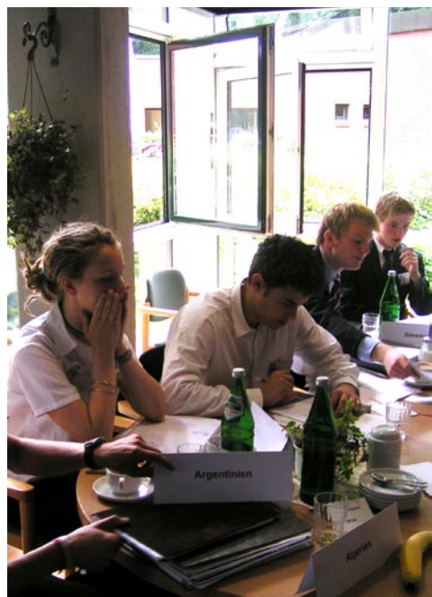
Total ausgepumpt: Der Sicherheitsrat

Man kann es ihnen nicht verdenken: Bei viel zu schwüler Luft in einem viel zu kleinen Sitzungsraum nach einer viel zu kurzen Nacht und einer viel zu aufreibenden Debatte am Vortag zeigten sich die Delegierten des Sicherheitsrates gestern Morgen wenig motiviert. Zwar hatte der Delegierte Dänemarks einen sehr fruchtbaren Resolutionsentwurf zur „Entspannung der Lage in der Demokratischen Republik Kongo“ eingebracht – die ziemlich müde dreinschauenden Delegierten nutzten aber die Qualität des Textes, um die ersten acht einleitenden Absätze ohne viel Geplänkel gleich zur Abstimmung zu stellen. Mit Erfolg: alle acht einleitenden Sätze wurden in die Resolution übernommen.