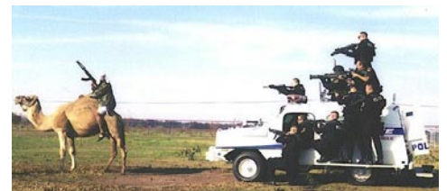
A delightful pastime indeed!

Nachdem die Fuchsjagd Anfang dieses Jahres von der britischen Regierung verboten wurde, mussten sich die Groß-Briten einen Ersatz für ihren Lieblingssport überlegen. Abhilfe war jedoch schnell gefunden. Man führte einfach die Jagd auf die zweitliebste Zielscheibe der Nation ein: Araber auf Kamelen. Um die Gemüter der tollwütigen Jäger zu besänftigen beschloss die Regierung sogar einige Exemplare aus angegliederten Gebieten zu importieren. Schon denkt Tony Blair einen Schritt weiter: nächstes Jahr soll die Kaninchenjagd durch die Asiatenjagd abgelöst werden. Alles für den Tierschutz!