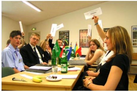
Abstimmung in Eintracht

GB-Ersatzdelegierte andere Ansichten als sein Teamkollege zuvor in der AK vertrat. Libyen fiel durch flammende Beiträge unter Einsatz von Händen und Füßen und einer extra weichen Aussprache des Sch („sicherlich“) auf. Die Delegation der Schweiz hatte überraschenderweise mit Problemen bei der Abstimmung zu kämpfen. Sie musste zweimal erschreckt feststellen, dass sie sich tatsächlich für Ja oder Nein entschieden hatte und drauf und dran war, den Kurs der strikten Neutralität zu verlassen. Inhaltlich war die Debatte von dem schließlich erfolgreichen Versuch geprägt, die Verantwortung für die Bekämpfung