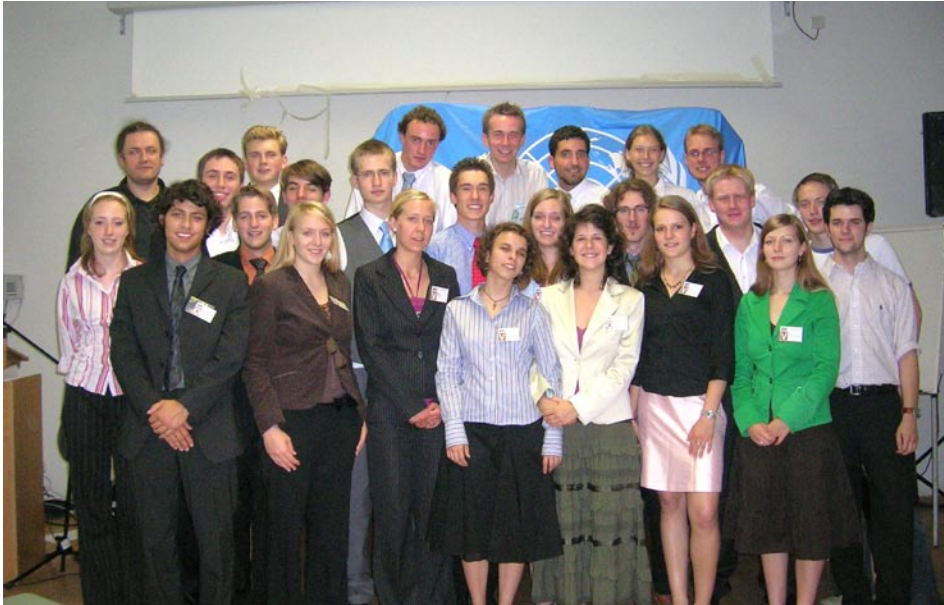
Eins, zwei, viele: Das SPUN-Orgateam

Als Delegierter hast DU in den letzten Tagen die Interessen deines UN-Mitgliedstaates vertreten, in kontroversen Debatten hast DU zusammen in Abhängigkeit multilateraler Beziehungen Resolutionen entworfen, verworfen und/oder verabschiedet.