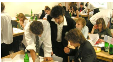
Kollaboration & Konsens

schlüssige Resolution mit guten Ansätzen verabschiedet. Hauptaspekt war die Einsetzung einer SOPEC-Organisation als Überwachungsinstanz der OPEC. So sollen „zu hoch definierte Preise“ und eine zu mächtige Rolle der Öl abbauenden Länder verhindert werden. Bis auf wenige Länder waren sich die Delegierten einig. So kam es, dass die USA in ihrer Pro-Rede für die meisten anderen Anwesenden sprach: „Die Resolution ist für die gesamte Welt ein guter Kompromiss. Die SOPEC als grundlegende Änderung ist ein großer Gewinn.“