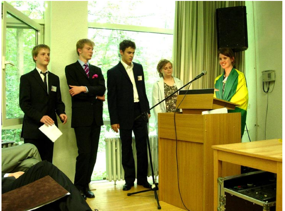
Schöner Schlange stehen mit Brasilien

Nach diesen durchweg interessanten und abwechslungsreichen Abschlussreden wurde das Wort an die einzelnen Vorsitzenden-Teams übergeben. Diese blickten zurück auf eine außergewöhnliche und sehr produktive Sitzungswoche. Insgesamt wurden 19 (!!!) Resolutionen verabschiedet.