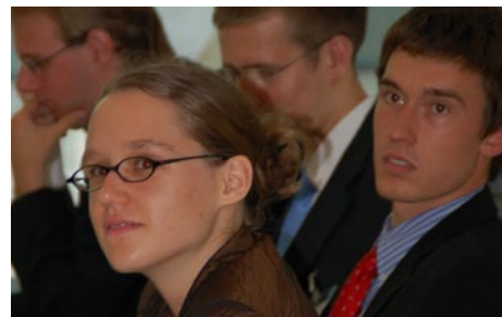
Geessin und Gees.

Die Sicherheitsratsvorsitzenden sahen sich genötigt, mit dem weit verbreiteten Vorurteil aufzuräumen, dass die Mitglieder dieses exklusiven Vereins eher durch Arroganz als durch Kompetenz bestäochen. Auch im Sicherheitsrat seien die Diskussionen nicht überhart gewesen, mit Wattebäuschen sei aber auch nicht geschmissen worden. Auch in diesem Jahr hat es der Sicherheitsrat wieder einmal erreicht, den Weltuntergang zumindest ein wenig zu verschieben. Der Generalversammlungsvorsitzende wurde die Ehre zuteil, mit ihrem Redebeitrag die 10. Sitzungswoche feierlich zu beenden.