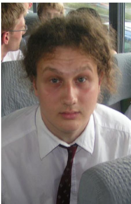
Ist froh, wieder nach Hause zu dürfen. Denn es ist wärmer als daheim: Sudan.