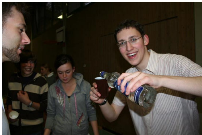
Es geht ums eingießen.

Alkohol lockert die Zunge und so wunderten sich nicht zuletzt ein paar Delegierte über die außerordentliche kommunikationsbereitschaft aller Staaten, die erschreckend, darstellte, wie sich Länder ohne Achtung ihrer eigentlichen Beziehungen beim Trinken und Rauchen verbunden haben. Und so möchten wir den Abend schließen mit einem Satz der Delegierten Kolumbiens in der AK: „Alle haben die Drogen Kolumbiens angenommen.“