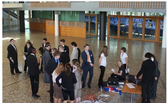
Der Überblick ging nicht verloren.

vor unbegründeter Kritik fürchten müssen, denn „[...]alles was ich sage ist richtig“.