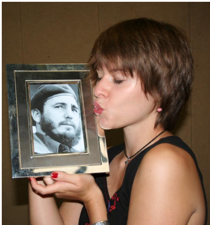
Kuba hat einen Liebling.

Hier schreibt nun Kuba. Also liebe Redaktion, ihr wolltet eigentlich, dass ich hier von der Nations Night berichte, aber da ihr nun das Wort „System“ genannt habt, kann ich ein-