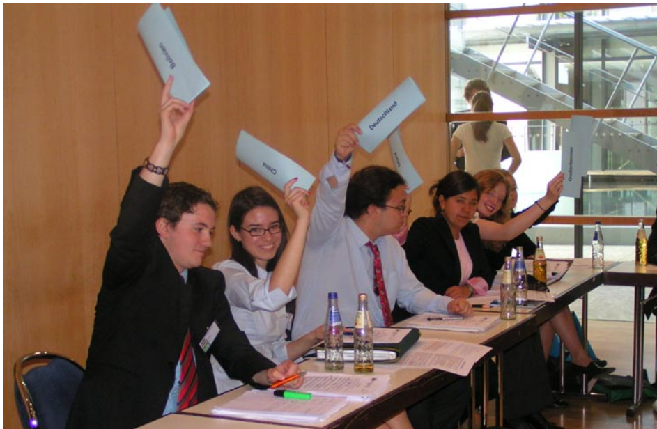
Wahnsinnige Zustimmung, besonders auf Seiten Boliviens.

So ist abschließend festzustellen, dass Klimaschutz wohl vorerst eine Glaubensfrage und wir möchten die Vertreterin Saudi Arabiens zitieren und fragen: „Sind sie zur richtigen Religion übergetreten?“